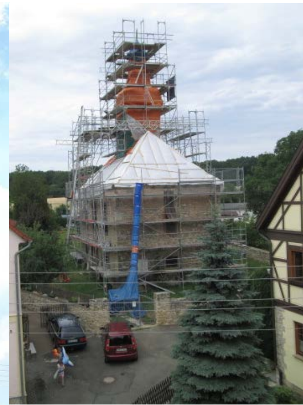
Dach und Turm