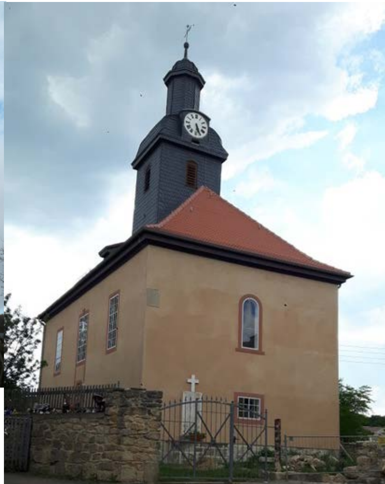
Neue Fassade Mai 2019