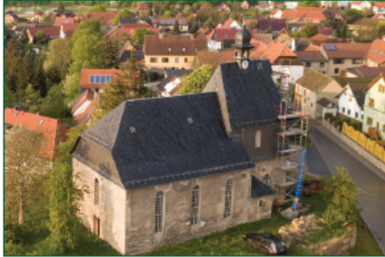
Luftbildaufnahme der Golmsdorfer Kirche mit Blick ins Saaletal