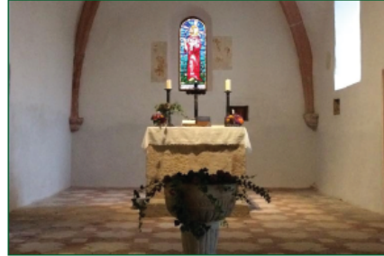
Restaurierter Chorraum mit den Originalfarben an den Gewölbezippen aus dem 15. Jh