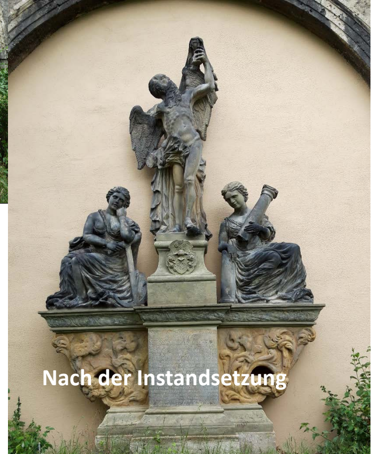
Nach der Instandsetzung